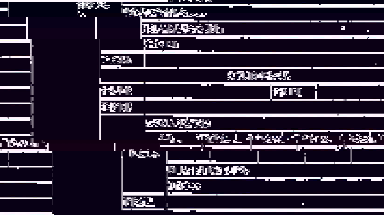
Figure 1: A detailed technical drawing of a mountain structure, likely a dam or bridge, showing various sections and components. The drawing is oriented vertically on the page. It features a large central vertical section with multiple horizontal layers. To the left, there are several smaller vertical sections. At the bottom, there are more detailed views of the structure's base and internal components. The drawing uses fine lines to represent structural details and shading to indicate depth and form.